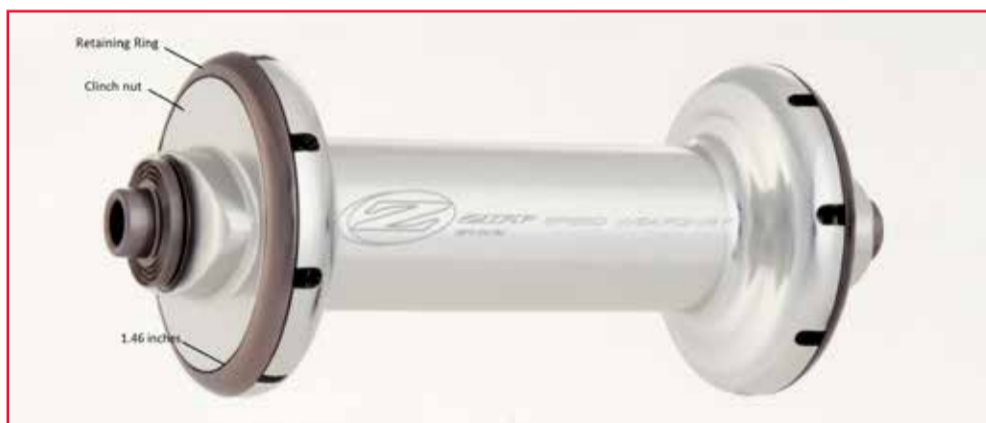
Abbildung 3 – nicht betroffene Nabe

Die Abbildungen UNTEN zeigen eine Zipp-Vorderradnabe, die von dem Rückruf nicht betroffen ist. Beachten Sie die größere, silberfarbene Mutter und den kleineren Sicherungsring.