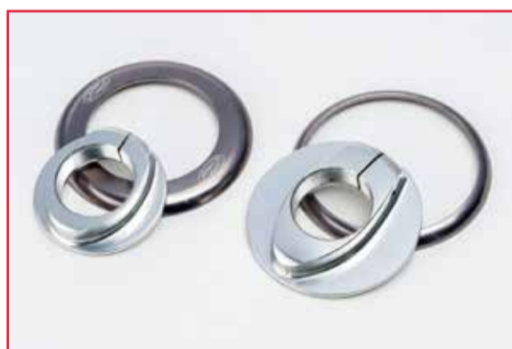
Abbildung 4 – links betroffen, rechts nicht betroffen

5. Die betroffene Nabe besitzt einen Ring und eine Mutter wie die linken Teile in der Abbildung (farbiger Ring mit „Z“-Logo und kleinerer Mutter). Die rechten Teile zeigen einen Ring und eine Mutter, die nicht vom Rückruf betroffen sind. Beachten Sie die größere Mutter (Durchmesser 37 mm) und den dünneren Ring ohne „Z“-Logo (ABBILDUNG 4).