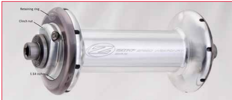
Abbildung 1 – Zipp-Nabe 88 der ersten Generation